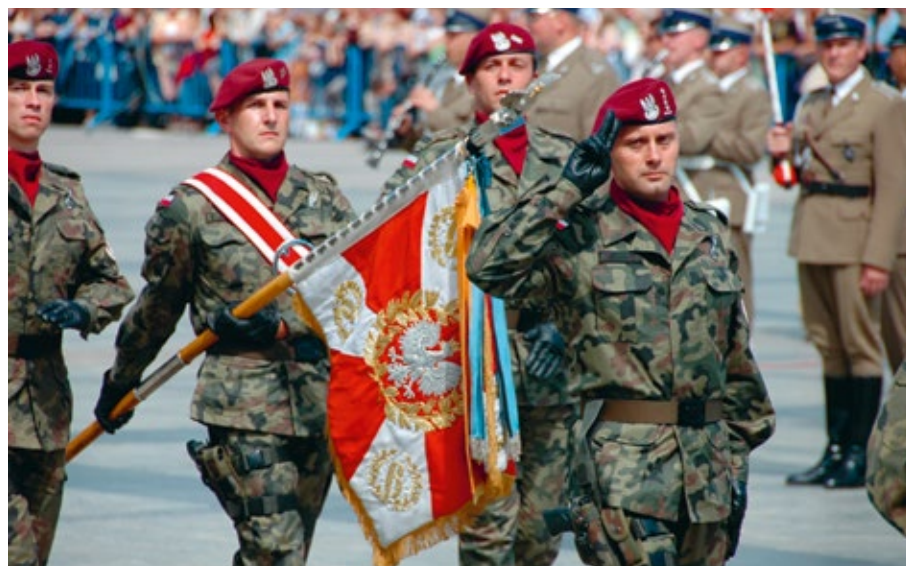
De (oranje) Militaire Willems-Orde aan het vaandel van de Poolse troepen werd in najaar 2006 voor het eerst getoond in Polen tijdens een parade in Warschau, waar ook de Poolse president bij aanwezig was. De mannen zijn van de Sosabowski brigade in Krakau

Geertjan Lassche is onderzoeksjournalist en documentairemaker.