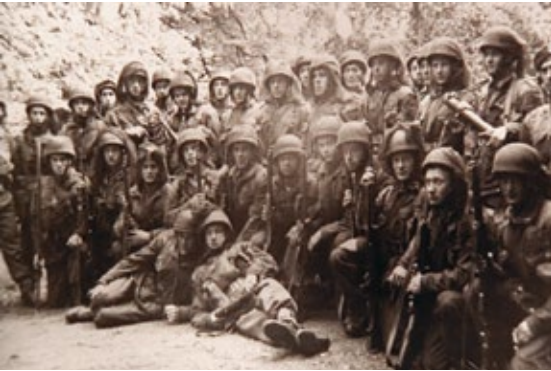
1° Poolse Onafhankelijke Parachutistenbrigade

bloedbad, maar het is aan dovemansoren besteed. Operatie Market Garden moet doorgaan. Terwijl de opstand in Warschau al is uitgebroken, en ze daar rekenen op de hulp van Sosabowski, worden hij en zijn Poolse parachutisten in september ingezet bij Arnhem. Het gaat inderdaad mis, de Duitsers bieden felle tegenstand. Door het slechte weer worden de Poolse parachutisten later gedropt dan gepland. Vanaf Driel roeien ze met rubberbootjes naar de overkant van de Rijn om zich bij de omsingelde Britten te voegen. Maar Duits mitrailleurvuur rijt de boten open, waardoor veel Polen de overkant niet halen. Toch is de Poolse inzet van grote betekenis. Duitse soldaten verklaren later dat juist de Polen meedogenloos waren. Eén van de grootste verdiensten van de Poolse para's is dat ze de Britse soldaten hebben geëvacueerd.