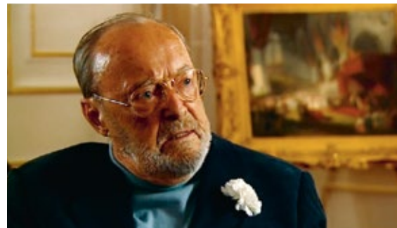
"Ik beschouw de Polen als de beste soldaten in de wereld," zegt prins Bernhard in God Bless Montgomery